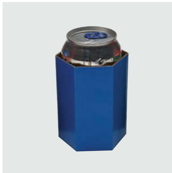
TH 306 Card Can-Holder