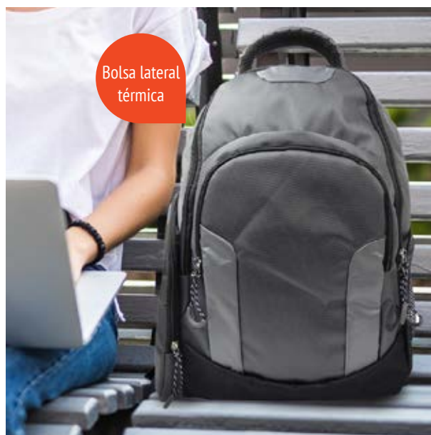
MAL 616 Backpack Sampras