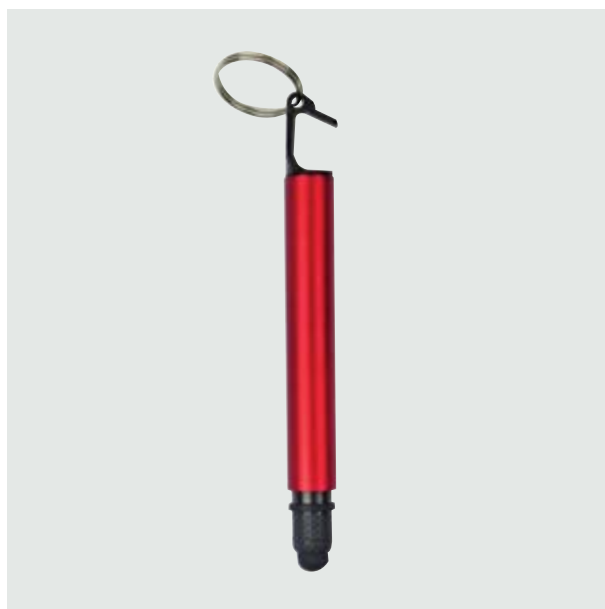
BOL 239 Bolígrafo Turrell